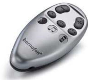
Brite – Brite – полная совместимость с дистанционным управлением

дистанционное управление Brite совместим с дистанционным управлением. Одним нажатием кнопки производится бинауральная смена программ или настройка уровня громкости.