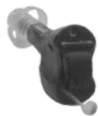
109/40 Latitude 16 Fuse