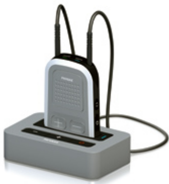
Phonak ComPilot с базовой станцией Phonak TVLink S.

Попросите своего специалиста-сурдолога продемонстрировать Вам необычайные возможности беспроводных аксессуаров Phonak.